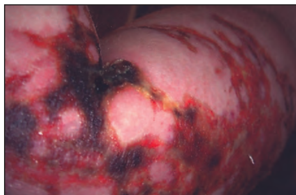
Figura 2. Evolución de las heridas a las 3 semanas.

Por la localización geográfica y el tipo de lesiones que presentaba, se pensó en una cubomedusa, la Chiropsalmus quadrigatus , como especie causante del accidente, también conocida popularmente como medusa caja, avispa marina, medusa cubo o diablo de Australia.