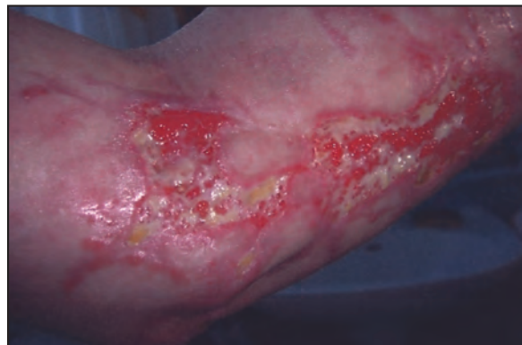
Figura 3. Evolución de las heridas a las 6 semanas.

Se le administraron 800 mg de paracetamol y 60 mg de dextropropoxifeno vía oral y se realizó cura de la herida, lavándola con suero fisiológico estéril, desinfección con clorhexidina, aplicación de pomada sulfadiacina argéntica, gasas vaselinadas y vendaje. La paciente fue dada de alta con tratamiento antiálgico y control en 48 horas. Las lesiones evolucionaron favorablemente y a los dos meses del accidente ya no presentaba zonas necróticas, el edema había disminuido y el tejido de granulación iba recubriendo las heridas (Figura 3). Durante un mes la paciente se estuvo curando la herida a diario, presentando a los cinco meses únicamente ligeras cicatrices en la parte interior del brazo.