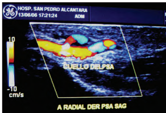
Figura 1. Corte longitudinal que muestra el pseudoaneurisma que comunica con la arteria radial derecha a través del cuello.

La técnica de obtención de la gasometría arterial ha de seguir una serie de recomendaciones para evitar las posibles complicaciones de la misma, siendo la localización radial la zona de primera indicación para su realización 1,2 . En los servicios de urgencias, la gasometría arterial es una técnica que se realiza con mucha frecuencia. Recientes trabajos abogan por el uso de analgesia tópica previamente a su realización, sobre todo en situaciones no emergentes, en personas con alta sensibilidad al dolor, o en sujetos frágiles como ancianos y niños 3,4 .