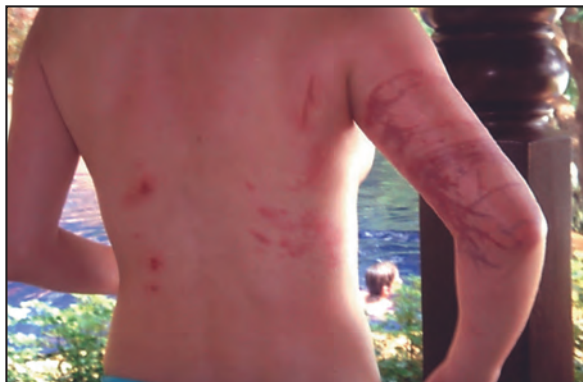
Figura 1. Lesiones aparecidas a las 12 h después de la picadura.

Tres semanas después de la picadura vuelve a París y acude a nuestro Servicio de Urgencias, donde presentaba un estado hemodinámico normal, afebril, sin prurito, pero con lesiones eritematosas y ulceraciones necróticas, linfadenopatía e intenso dolor (Escala Visual Analógica de 7-8/10).