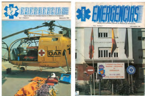
Figura 1. Portadas de los números 0 (izquierda) y 1 (derecha) de EMERGENCIAS.

da: sencillez y claridad. Así, la tipografía se ha cambiado, en todas las secciones de la revista, por una más actual y de un tamaño más grande que la previa. El espacio que así se haya podido perder se ha recuperado en buena medida ampliando la superficie de página utilizada y dejando menos márgenes en blanco. Para los trabajos publicados en las ya clásicas secciones de Originales, Editoriales, Revisiones, Documentos de Consenso, Artículos Especiales, Puntos de Vista, Notas Clínicas e Imágenes los nombres de los autores se presentan, ahora en todas ellas, en la cabecera del artículo y de forma completa (permite distinguir entre hombres y mujeres), y los apellidos se significan de forma clara escribiéndolos en mayúsculas (facilita su identificación por parte de lectores no acostumbrados a la onomástica latina). El sumario (requerido en todas estas secciones excepto Editoriales, Puntos de Vista e Imágenes), que en muchas ocasiones es lo único que se lee un lector no interesado específicamente en el tema en cuestión, adquiere un mayor protagonismo, con un tamaño suficiente para una lectu-