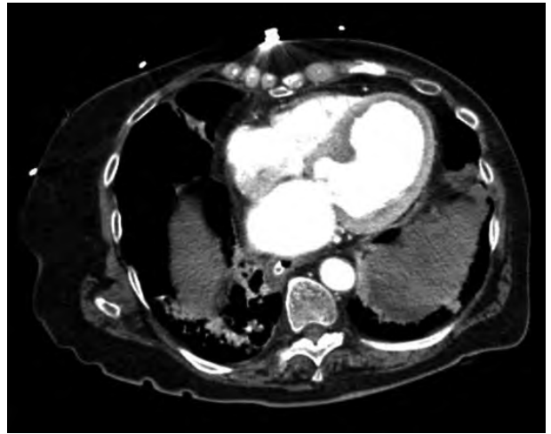
Figura 1. Hematoma periesplénico.

La rotura de bazo sin traumatismo previo es una entidad rara, y puede ser espontánea (rotura de un bazo normal) y patológica (bazo afectado por alguna enfermedad) 1 . Aunque la porción distal de la cola pancreática mantiene estrecha relación con vasos esplénicos y ligamento esplenorrenal, la rotura espontánea de bazo está descrita como una complicación rara de la pancreatitis en relación con: la extensión de la pancreatitis necrotizante a bazo, la erosión del hilio esplénico por pseudoquiste en cola pancreática, las adherencias periesplénicas tras pancreatitis recurrente, la oclusión de la vena esplénica por inflamación pancreática, o la inflamación aguda del tejido ectópico pancreático dentro del propio bazo 2-5 .