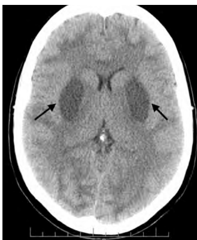
Figura 1. Imagen de tomografía craneal donde se puede observar el aumento de densidad bilateral y simétrica (flechas negras), en áreas putaminales consistente con foco hemorrágico y signos de edema cerebral.

El metanol (CH 3 -OH), también conocido como alcohol metílico, es una sustancia altamente tóxica, que por su degradación hepática produce formaldehído y ácido fórmico, responsables de la toxicidad, por lo que