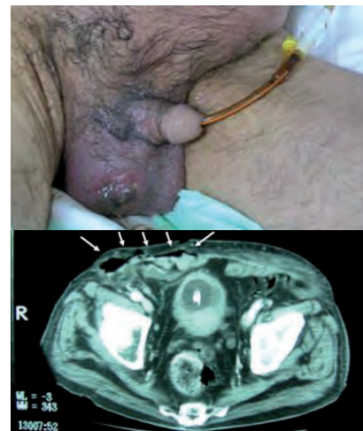
Figura 1. Imagen que muestra un aumento testicular derecho, con lesión ulcerada con drenaje (arriba). TC abdominal que muestra colección de burbujas de gas por delante del músculo recto anterior (abajo, flechas).

tía una herida ulcerada en la piel del escroto derecho. La presión arterial era de 80/40 mmHg y la temperatura de 38,3°C, su aspecto era séptico, estaba mal profundamente y con bajo nivel de conciencia. Había una placa eritematosa, indurada a nivel de hipogastrio, con dolor a la palpación, y un aumento del tamaño testicular derecho, fluctuante, con lesión ulcerada-necrótica que drenaba de forma espontánea un líquido purulento de olor fétido (Figura 1, parte superior). En la analítica destacaba: 17.400 leucocitos/ \mu L (92,8 N, 3,3 L); urea 127 mg/dl; sodio 150 mEq/L; potasio 3,6 mEq/L; creatinina 1,4 mg/dL. La tomografía computarizada (TC) abdominal mostraba una colección de burbujas de gas por delante del músculo recto anterior izquierdo a la altura de la próstata, que se extendía desde la apertura de los planos del lado derecho a nivel de la FID (Figura 1, parte inferior). Se inició tratamiento con imipenem 2 g/8 h i.v. De forma urgente se realizó una orquiectomía inguinal derecha y un amplio desbridamiento inguinoescrotal derecho y de las zonas de necrosis. El paciente falleció en el postoperatorio inmediato. A posteriori , en las muestras microbiológicas se aisló Morganella morganii y Providencia stuartii en el cultivo del exudado y Enterococcus faecalis en los hemocultivos.