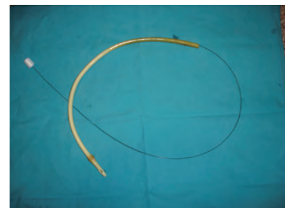
Figura 2. Sonda Foley con el fiador del Drum® usado en el presente caso.