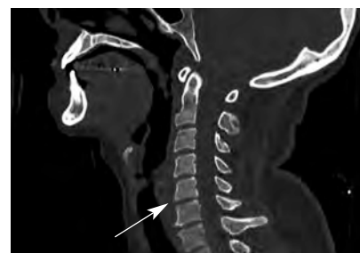
Figura 2. TC de columna cervical, corte medial. Se aprecia fractura vertebral con fragmento óseo anterior a la vértebra C5 (flecha). Canal medular íntegro.