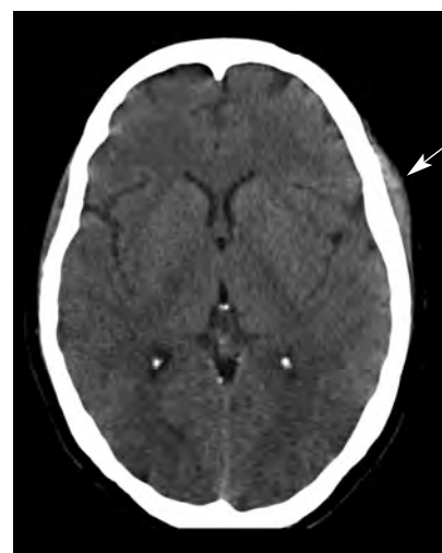
Figura 1. TC de cráneo, corte axial. Cefalohematoma izquierdo (flecha).