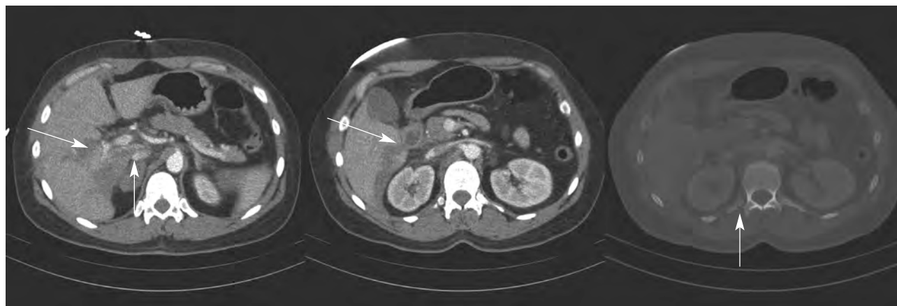
Figura 4. TC abdominal con contraste, cortes axiales. Izquierda: laceración hepática con pequeña cantidad de líquido libre hiliar (flecha). Centro: hematoma de glándula suprarrenal derecha (flecha). Derecha: Fractura de apófisis transversa de vértebra lumbar (flecha).

cientes 5 . La WBCT multicorte ahorra tiempo si se la compara con las técnicas diagnósticas radiológicas como la radiología simple, la ecografía o la TC no multicorte 6 . No obstante, hasta recientemente no se había demostrado el beneficio de esta técnica sobre la mortalidad 7 . Estos autores concluyeron que la realización de la WBCT se asocia a una estadística y clínicamente significativa reducción del 30% de la mortalidad 7-9 , respecto a aquellos pacientes en los que no se realizó una TC o sólo de determinadas regiones. Y la recomiendan como un método diagnóstico estándar durante la atención inicial al paciente con traumatismo grave. A este estudio, el primero que demuestra una mayor supervivencia de los pacientes sometidos a WBCT, se le ha criticado una innecesaria exposición radiológica del paciente y al contraste yodado 10 para el paciente, y que debido a que la dosis efectiva para determinados órganos puede acumularse, ello incrementaría potencialmente el riesgo individual de cáncer 11 . La WBCT de un solo barrido presenta una menor exposición radio-