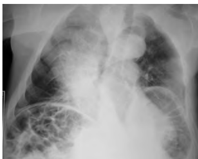
Figura 1. Radiografía de tórax en la que se observa la interposición de colon y de intestino delgado en ambos espacios subfrénicos. Escoliosis severa de la columna dorsal.

Varón de 80 años de edad con antecedentes patológicos de isquemia arterial crónica de miembros inferiores e hipertensión arterial, que ingresó en urgencias por molestias abdominales difusas y estreñimiento de larga evolución. En la exploración física el abdomen se encontraba distendido, timpánico y con ausencia de matidez hepática (signo de Joberg). Se realizó una radiografía de tórax posteroanterior que reveló la inter-