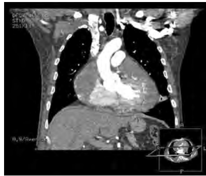
Figura 1. Imagen de tomografía computarizada.

El angiosarcoma pericardico es una entidad poco habitual y con frecuencia de difícil diagnóstico debido a que se presenta con síntomas y signos inespecíficos, pero la confirmación de invasión mediastínica y metástasis extracardiacas se logra a través de la tomografía computarizada (TC) y la resonancia magnética (RM). A pesar de los avances en las técnicas quirúrgicas, este tumor sigue teniendo un pronóstico infausto. Los tumores pericárdicos constituyen una causa relativamente frecuente de taponamiento cardiaco 1 . En la mayoría de ocasiones son de origen metastásico procedentes de tumores primarios de otros órganos. Los tu-