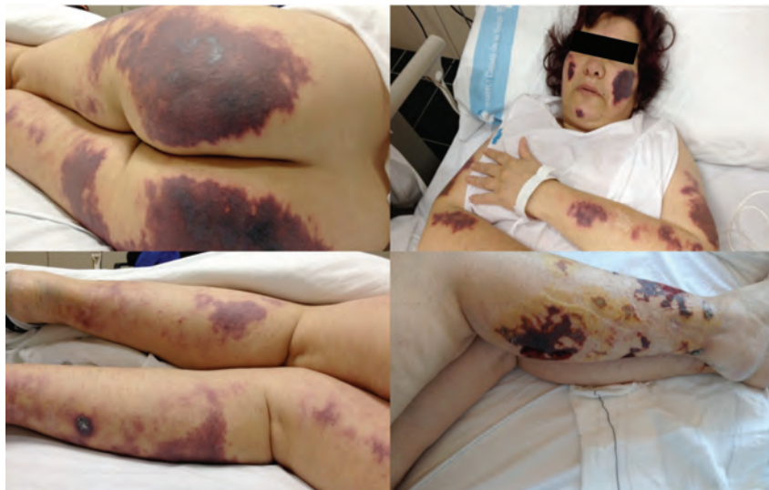
Figura 1. Lesiones vasculíticas en los glúteos, las extremidades y la cara de la paciente a su llegada a urgencias.

ta su diagnóstico, pero en consumidores habituales de cocaína, la detección del levamisol no se considera esencial para el diagnóstico. Desde el punto de vista inmunológico se puede observar la presencia de ANCA con patrón perinuclear en el 88% de los casos, aunque el patrón citoplasmático también está descrito. Otros hallazgos característicos son la positividad para los anticuerpos antifosfolípidos y los anticuerpos antielastasa. En nuestro caso la paciente presentó positividad para ANCA patrón perinuclear, anticuerpos antielastasa y anticuerpos antifosfolípidos positivos, que posteriormente se negatizaron 4,7 .