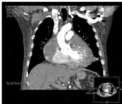
Figura 1. Imagen de tomografía computarizada.

El angiosarcoma pericardico es una entidad poco habitual y con frecuencia de difícil diagnóstico debido a que se presenta con síntomas y signos inespecíficos, pero la confirmación de invasión mediastínica y metástasis extracardiacas se logra a través de la tomografía computarizada (TC) y la resonancia magnética (RM). A pesar de los avances en las técnicas quirúrgicas, este tumor sigue teniendo un pronóstico infausto. Los tumores pericárdicos constituyen una causa relativamente frecuente de taponamiento cardiaco 1 . En la mayoría de ocasiones son de origen metastásico procedentes de tumores primarios de otros órganos. Los tu-