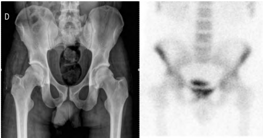
Figura 1. Radiología de pelvis (izquierda) donde se observa una discreta esclerosis subcondral y gammagrafía con galio (derecha) que muestra una hipercaptación en la sínfisis púbica.

to, atletismo y procedimientos quirúrgicos del sistema digestivo, urológico y genital. El tratamiento se basa en AINES o corticoides, con buen pronóstico 3-6 . La osteomielitis pélvica corresponde a menos del 10% de todas las osteomielitis 4 . Los gérmenes más frecuentemente son Staphylococcus aureus , seguido por Pseudomonas aeruginosa y por último, infecciones polimicrobianas 6 . La osteomielitis púbica y la artritis séptica de la sínfisis púbica requieren hospitalización para el tratamiento antibiótico intravenoso, y su retraso puede ocasionar secuelas: inestabilidad pélvica, perforación de la vejiga urinaria o dolor pélvico crónico, teniendo una mortalidad asociada en torno al 2% 6 .