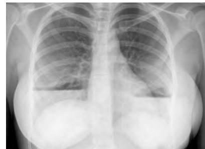
Figura 2. Radiografía de tórax que muestra los implantes mamarios bilaterales y niveles hidroaéreos en su interior.