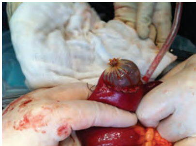
Figura 2. Extracción manual intraoperatoria intestinal de los preservativos que contienen la cocaína.