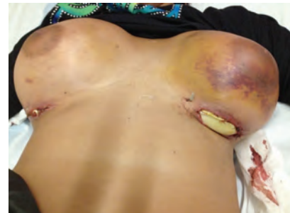
Figura 1. Exposición parcial de los cuerpos extraños implantados a través de las incisiones submamarias.

Mujer de 23 años remitida desde el aeropuerto a urgencias, custodiada por agentes de la Policía Nacional, por sospecha de transporte intracorporal de sustancias ilícitas. La paciente refería el antecedente de intervención quirúrgica reciente en forma de implantes protésicos mamarios bilaterales, realizada en su país de origen (Panamá). A la exploración destaca tumefacción mamaria bilateral con hematomas cutáneos en fase de resolución y dehiscencia incompleta de las cicatrices quirúrgicas submamarias, con exposición parcial del material implantado (Figura 1). La radiografía de tórax evidencia cuerpos extraños en ambas mamas, con nivel hidroaéreo en su interior (Figura 2). Se confirmó la presencia de metabolitos de cocaína en el análisis de orina. Se procedió a la retirada de los